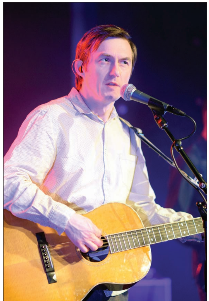
KOM TIL SINE EGNE: Nei, det var ikke mange sørvestlendinger blant publikum, men dedikerte Tønes-tilhengere med stor sans for hans underfundige hverdags-poesi.

Tønes har på sine to siste album lagt seg i selen også når det gjelder melodikomposisjon, arrangement og produksjon. Fra å være levende lydtkullisser har bandet hans de siste fem år tatt sjumilssteg, dog